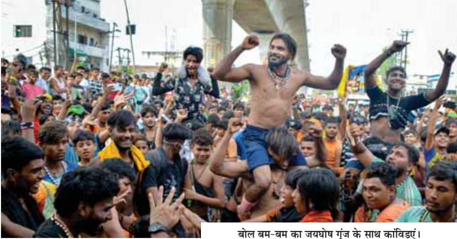
बोल बम-बम का जयघोष गूंज के साथ कांवड़ियां।

भगवान आदि कैलाश की बड़ी प्रतिमा की झांकी सजा कर ला रहे दिल्ली के कांवड़ियों ने बताया कि लगातार कई सालों से कांवड़ ला रहे हैं और हर भगवान भोले की झांकी बनाकर हरिद्वार से जल लेकर निकलते हैं। 22 सदस्यों के यह दल